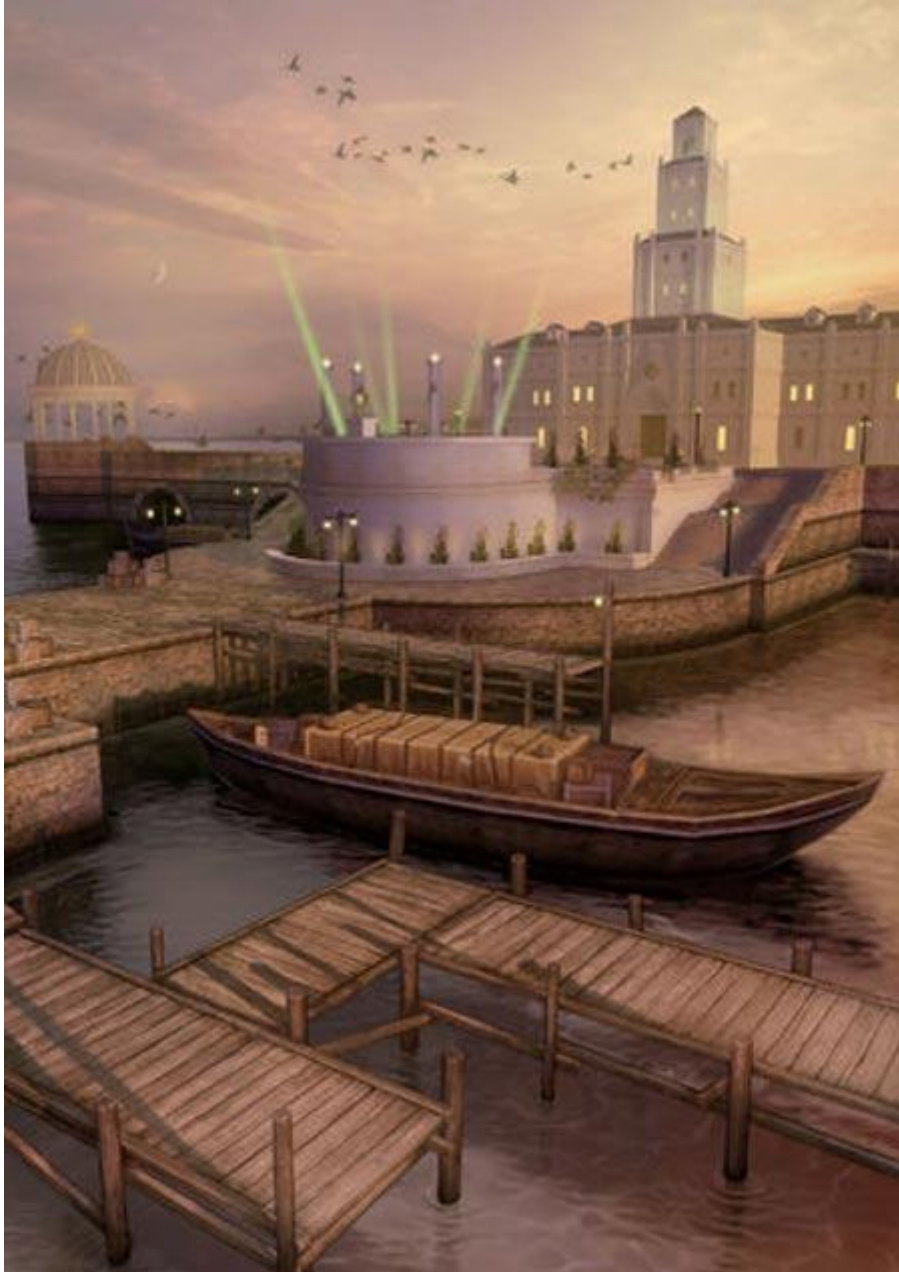
Une représentation artistique de ce à quoi aurait pu ressembler Hy-Brasil ( Wikia )

Il existe beaucoup de mythes et légendes entourant Hy-Brasil. Dans certaines d'entre elles, l'île est la demeure des dieux dans la tradition irlandaise. Dans d'autres, elle est habitée par des prêtres ou des moines dont on dit qu'ils détiennent un savoir ancien qui leur a permis de créer une civilisation avancée. Certains pensent que le fameux voyage de St. Brendan pour trouver la « Terre Promise » pourrait l'avoir conduit à Hy-Brasil.