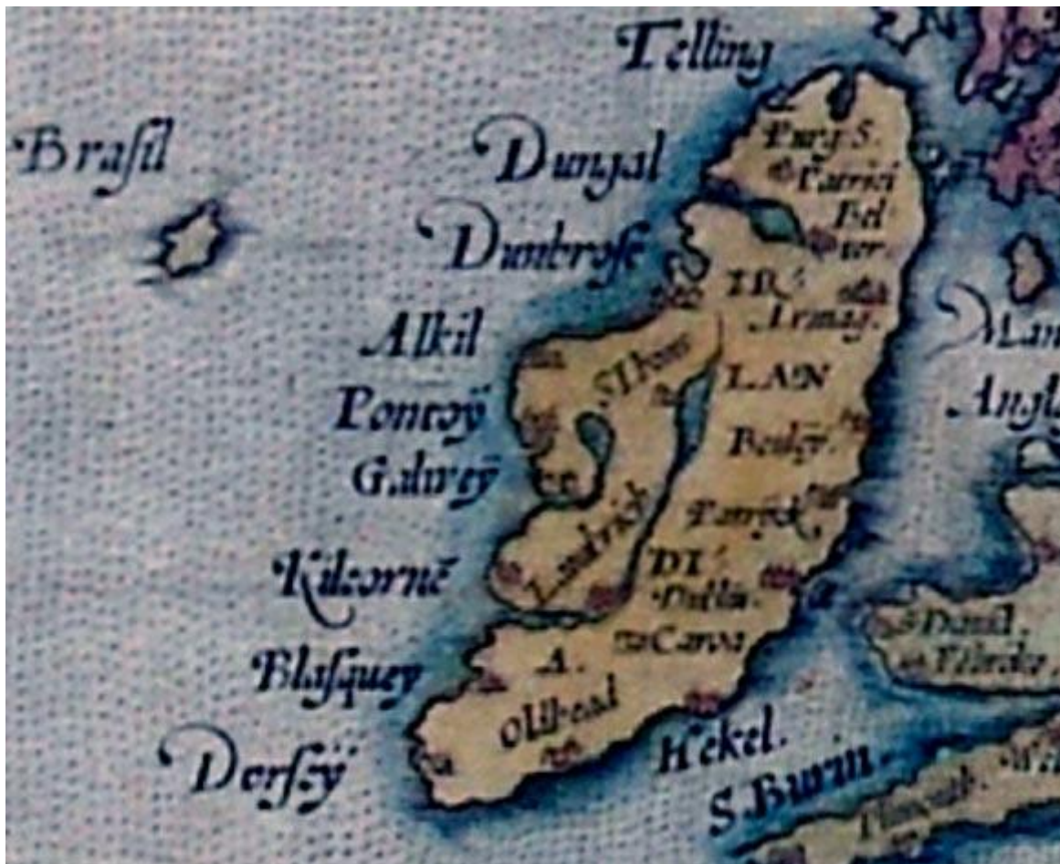
Hy-Brasil (ici simplement Brasil), détail de la Carte d'Europe d'Ortelius ( Wikimedia Commons )

la Carte de l'Europe d'Ortelius ( Ortelius Map of Europe ) et sur la carte Mercator de l'Europe ( Europa Mercator Map ) et à l'occasion apparut à des emplacements légèrement différents sur différentes cartes au fil du temps.