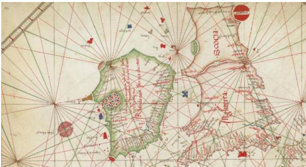
La charte nautique d'Europe de l'Ouest (1473) montre Hy-Brasil sous une forme circulaire

Près de deux siècles plus tard, le capitaine au long cours écossais, John Nisbet, prétendait avoir repéré Hy-Brasil au cours de son voyage depuis la France vers l'Irlande en 1674. Il aurait envoyé une équipe de quatre marins à terre, où les marins ont passé la journée entière sur l'île.