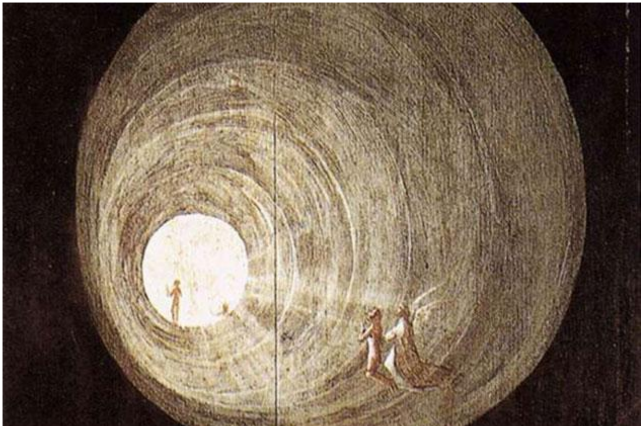
Détail du tableau „Der Flug zum Himmel“ (envol vers le ciel) (Hieronymus Bosch, environ 1500).